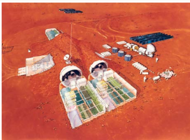
↑ Ilustración de asentamiento en Marte (NASA)

A lo mejor las primeras colonias de humanos llegan a Marte en 2026, pero seguro que no tendrán una vida fácil.